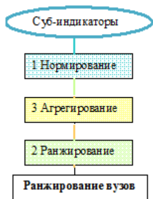
Рисунок 3. Алгоритм построения ранжирования

Для построения ранжирований нормированные данные по различным индикаторам агрегируются для получения оценки деятельности вуза по каждой из пяти функций и/или получения общей оценки деятельности вуза. Вузы, с присвоенной агрегированной оценкой, затем ранжируются от вуза с наиболее высокой оценкой к вузу с самой низкой оценкой. (Рис. 3)