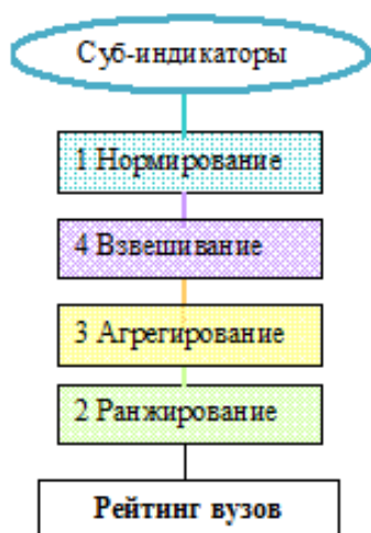
Рисунок 4. Алгоритм построения рейтинга

Веса несут в себе оценочную информацию, увеличивая значения одних индикаторов по отношению к другим, вследствие чего после агрегирования взвешенных субиндикаторов значение комплексного индикатора вуза меняется: взвешивание может повысить значение комплексных индикаторов отдельных вузов, тем самым, давая им преимущество и повышая их положение в рейтинге.